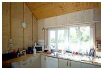
Intérieur d'une maison

L'éco-prêt à taux zéro est cumulable avec les aides de l'Agence nationale de l'habitat (Anah) et des collectivités territoriales, les certificats d'économies d'énergie et le prêt à taux zéro octroyé pour les opérations d'acquisition-